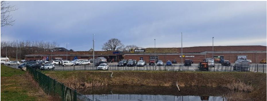
Oft findet man am Tobringer kaum noch einen Parkplatz zum Einkaufen.

Heikendorfer Gewerbetreibende benötigen dringend neue Gewerbeflächen. Südlich der B502 am Lehmkamp wäre ein idealer Platz dafür. Aber auch Firmen von außerhalb würden sich gern in Heikendorf ansiedeln. Eine Ansiedlung auf dieser Fläche muss von der Gemeindevertretung nachdrücklich gefordert werden.