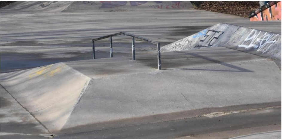
Der Skaterpark am Schulredder ist ein beliebter Treffpunkt für Jugendliche.