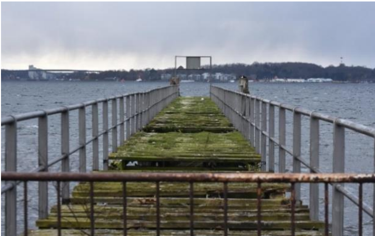
Die Altheikendorfer Brücke zum Leben wiedererwecken.

Elektrofahrzeuge werden sich erst durchsetzen, wenn auch Menschen, die keine Lademöglichkeit auf ihrem Grundstück haben, auf kurzem Weg einen öffentlichen Ladepunkt benutzen können. Hier muss die Gemeinde noch sehr viel mehr Lademöglichkeiten schaffen.