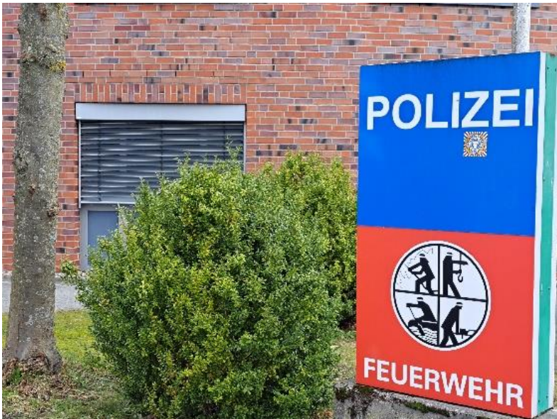
Polizei und Feuerwehr Hand in Hand. Ein Glücksfall für Heikendorf.

Wir werden ein Konzept auf den Weg bringen, wie wir den Eigenschutz für Hausbesitzer und Mieter z.B. gegen Einbruch den Betrug an älteren Bürgerinnen und Bürgern und die Sicherheit im Verkehr durch geeignete Projekte und Kampagnen als Gemeinde verstärken können.